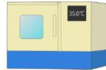
Llevar la placa en incubación