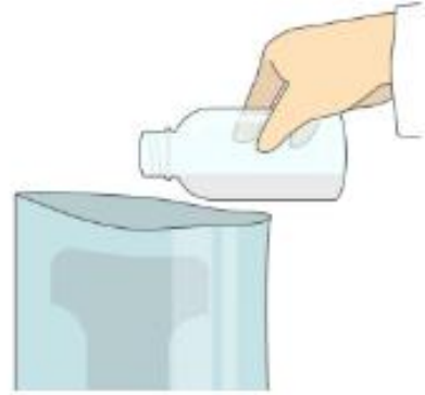
Agregar el diluyente