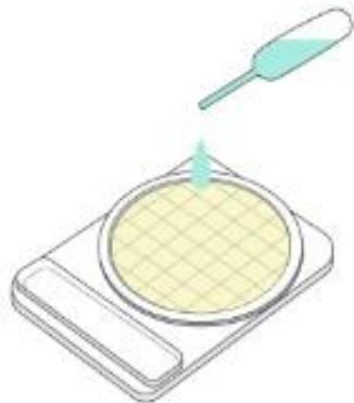
Agregar 1 ml de muestra