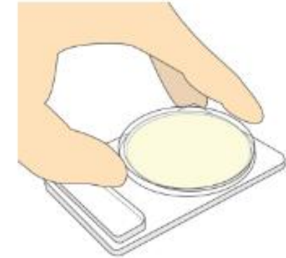
Retirar la tapa