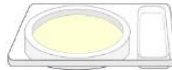
Poner la placa hacia abajo