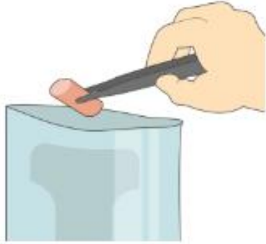
Pesar la muestra